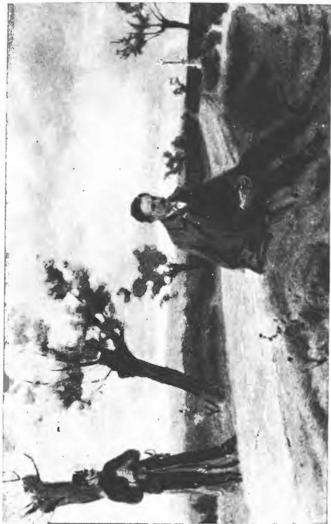
Франко на естапі. Картина В. Савіна. 1955.