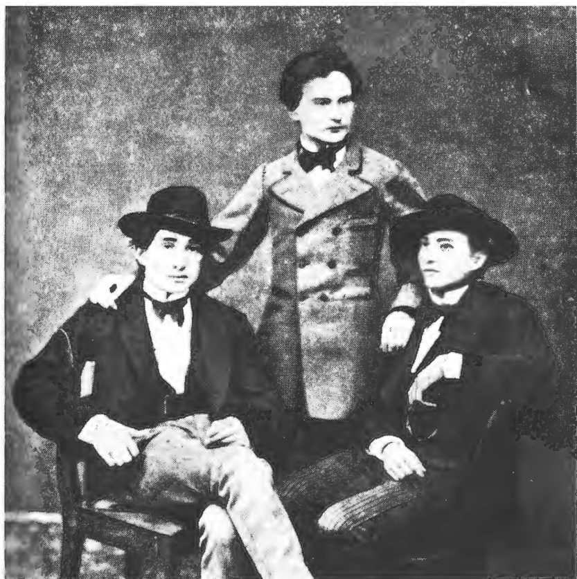
І. Франко — студент університету серед своїх товаришів — І. Погорецького і Я. Рошкевича.