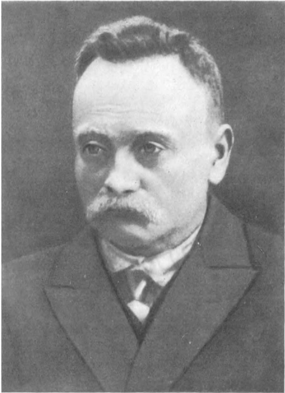
Іван Франко Фото. 1913