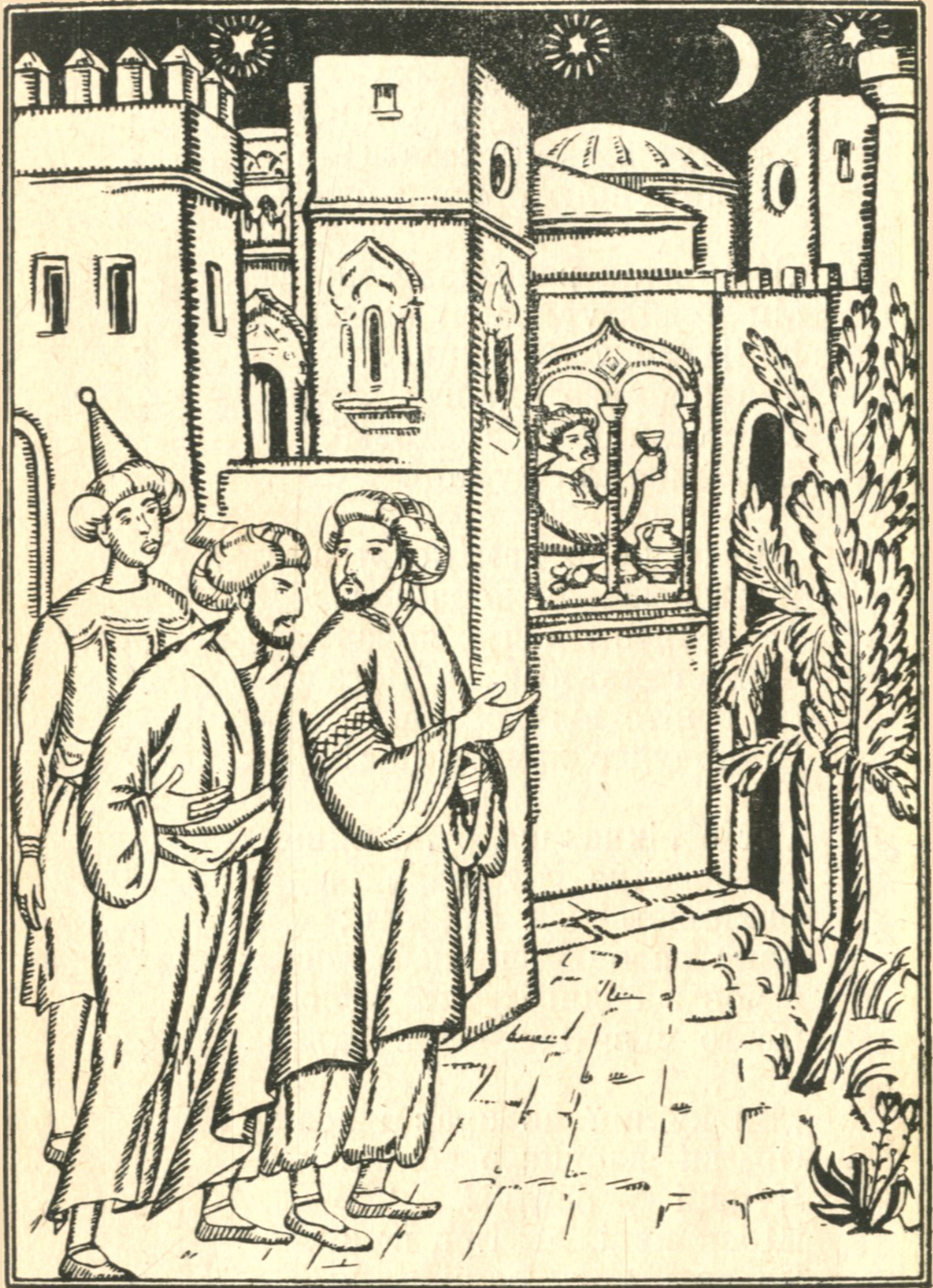
Illustration of a night scene in a city, showing three men in traditional attire standing in the foreground, and a man visible through an arched window in the background, holding a glass. The scene is set against a dark sky with a crescent moon and stars.